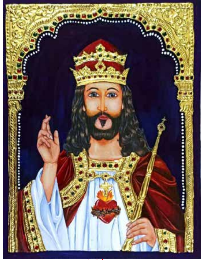
Art by Renie Swetha. F, B Arch Chennai

சே. ஷெர்லின் மரியா பனங்குளம் சிவகங்கை மாவட்டம்